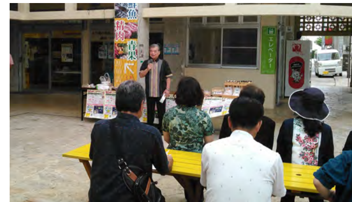
写真: 7月2日名護まちなか交流マルシェオープニング