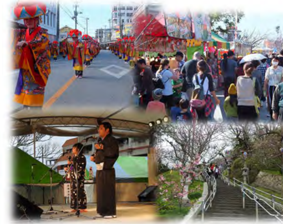
※写真は過去の開催風景です。

「日本の春はここからはじまる」1月26日(土)、27日(日)の二日間、今年も名護さくら祭りが開催されます。皆様ぜひご来場下さい。