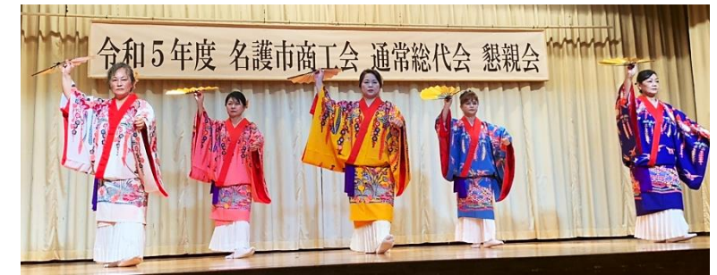
女性部 かぎやで風

令和5年5月19日(金)「ホテルゆがふいんおきなわ」にて総代会が開催され、以下の議案が承認されました。また、役員功労者6名へ感謝状が贈呈され、優良事業所表彰3事業所、永年勤続優良従業員表彰129名へ表彰が行われ、4年ぶりの懇親会も開催されました。