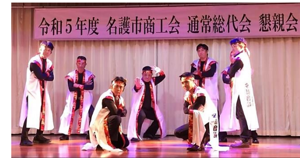
青年部 新名護音頭