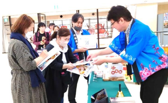
写真：池袋サンシャインシティにてPR

令和5年5月31日(水)～6月4日(日)までにて、名護市観光情報・ふるさと納税のPRを行いました。パンフレットは2,000部配布し、アンケートでは522人回答で、名護市の認知度は91%という結果でした。ふるさと納税返礼品のサンプルを展示することにより、多くの方々への目に触れ、更に認知度の向上に繋がってきました。