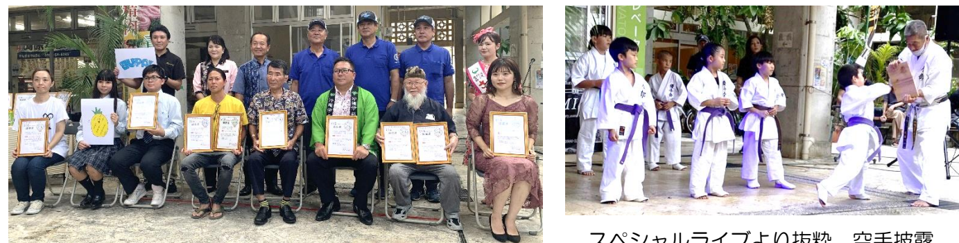
スペシャルライブより抜粋 空手披露

特産品認証制度「くくるナゴ Story」 7社9品 認定 「気づく、動く、つながる 名護市1町4村物語」がテーマ