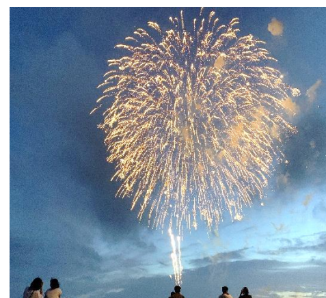
青年部よりPM7:50に花火の打上