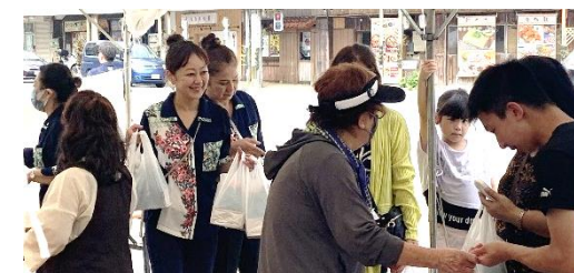
女性部より来場者へ花苗木の配布