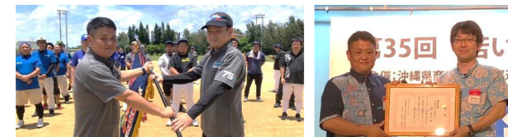
ソフトボール大会県準優勝 主張発表北部支部優秀賞

青年部は若手経営者として総合的な改善発展を図り、地域の振興・発展、社会一般の福祉の増進、新しいまちづくりに取り組む組織です。その一環として、各商工会青年部との交流会がありました。新入部員随時募集中です。