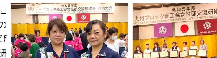
県内の女性部は43名参加し、名護からは2名参加

女性部は女性ならではの視点で、地域の活性化に向けた取り組みを行っております。今回は九州の各商工会女性部員が一同に会し、知識の習得並びに組織及び事業活動の強化を図ることを目的に研修会が開かれました。新入部員随時募集中です。