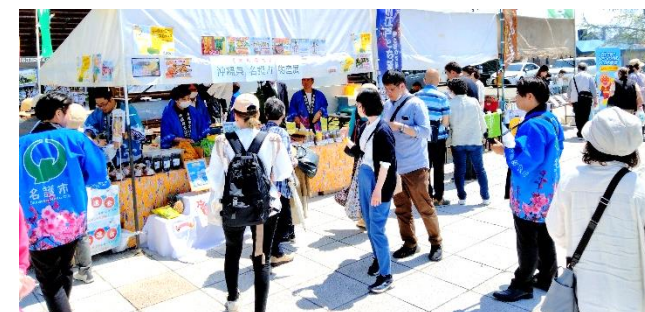
北海道滝川市にて名護市の特産品販売