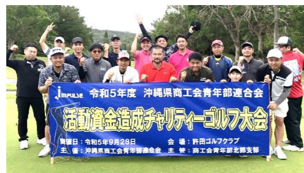
59名中17名が名護から参加

11月の活動は全国大会が群馬県で開催され、全国の青年部員が集結し、経営者・後継者としての資質向上を目的に行われます。