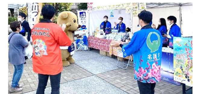
大阪府枚方市にて名護市の観光PR

名護市商工会では物産展・特産品の開催情報やセミナー情報などメール発信しております。