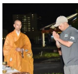
7月28日(金) まつり会場で安全祈願