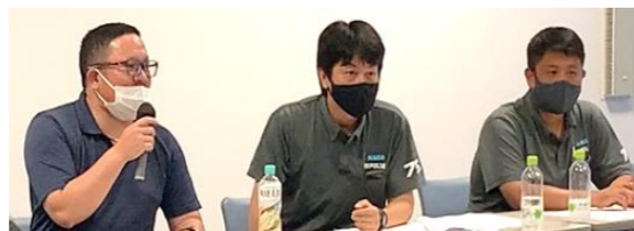
5月9日(火)～ 名護夏まつり実行委員会始動 (広報・設営整備・総務・行事・管理・警備)