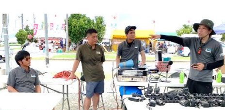
まつり当日 実行委員会ミーティング