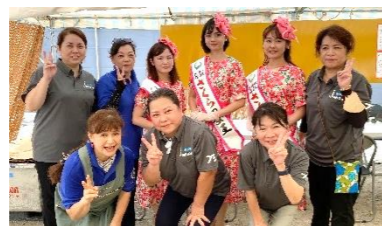
商工会女性部・ボランティアスタッフから多大なるご協力