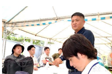
まつり直前 実行委員会ミーティング・会場設営