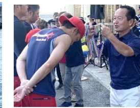
男子119チーム・女子14チーム参加